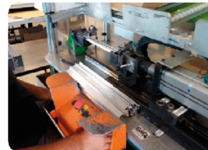
Assemblage et perçage semi-automatisé-manuel