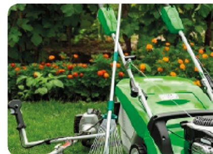
Entretien Espaces Verts

Des activités industrielles et prestations de service variées proposées à 51 travailleurs.